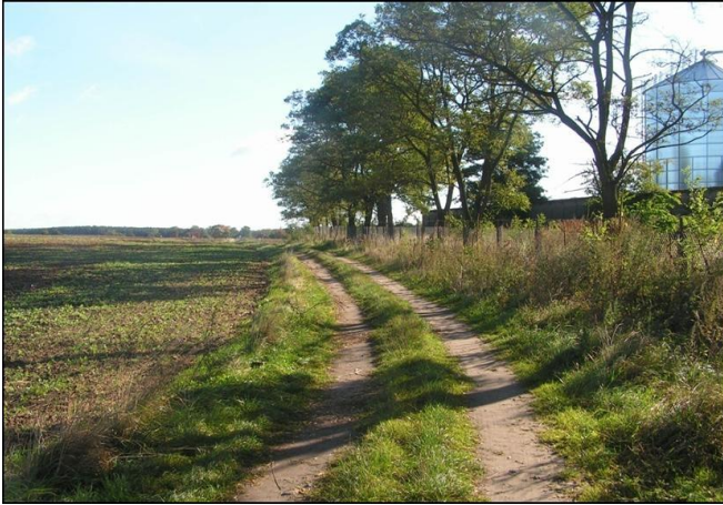
Stan przed scaleniem