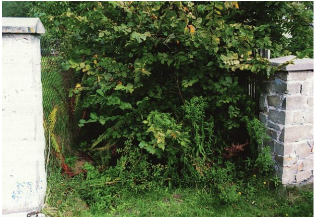
Stan przed scaleniem