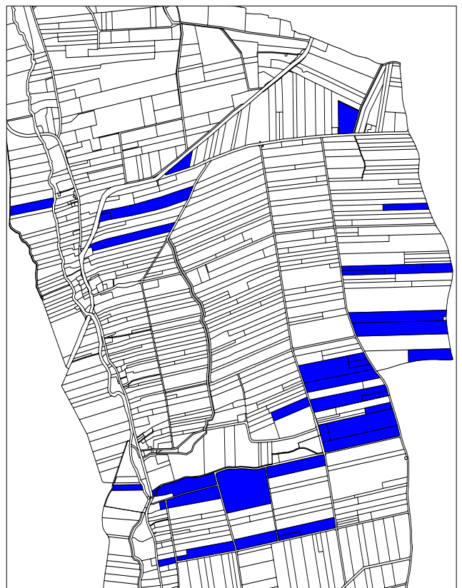
Po scaleniu 32 działki o łącznej powierzchni 46,07 ha