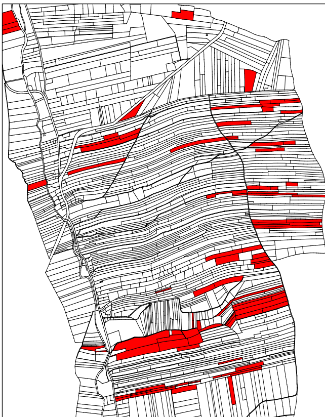
Przed scaleniem 97 działek o łącznej powierzchni 45,02 ha