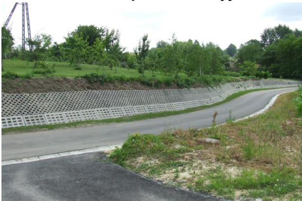
Płyty JOMBO – działanie przeciwoerozyjne