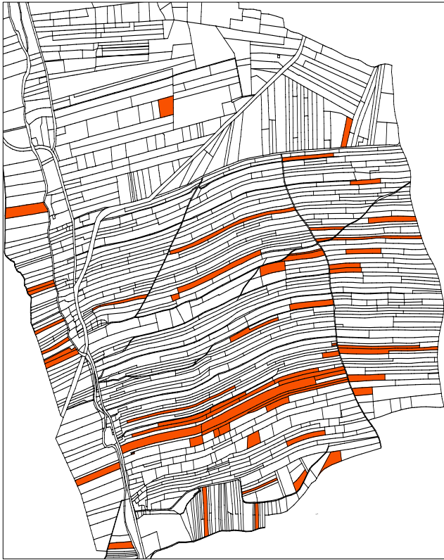
Przed scaleniem 58 działek o łącznej powierzchni 26,67 ha