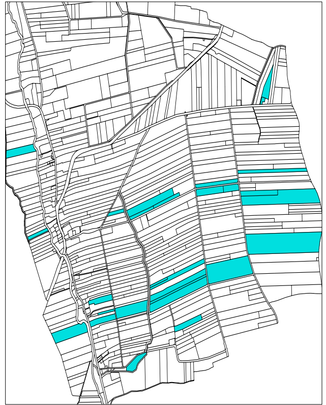
Po scaleniu 21 działek o łącznej powierzchni 31,27 ha